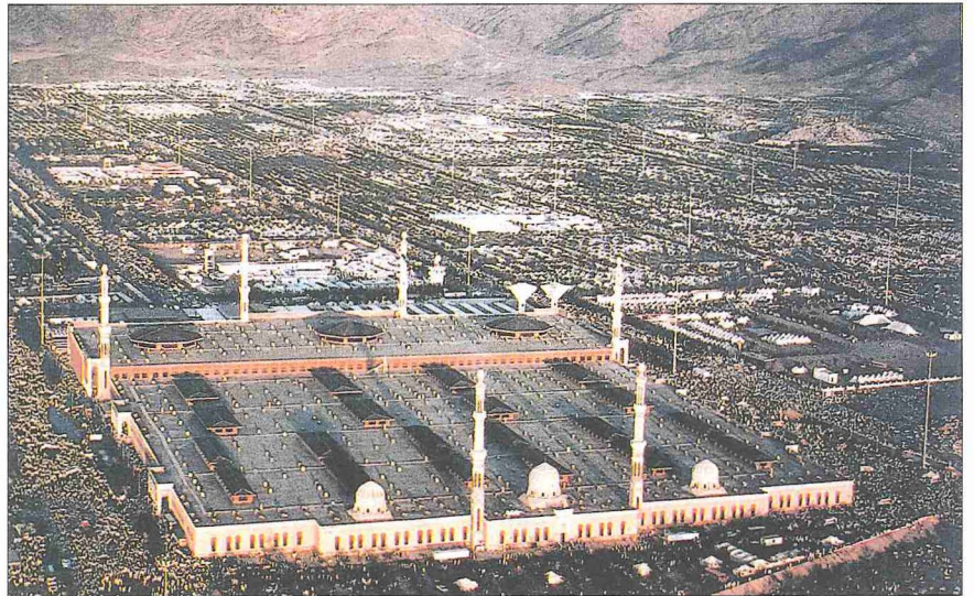
Mescid-i Nemire – Arafat / Mekke

Resûl-i Ekrem'in insanlara hitap et-mesi için Urene'de küçük taşlardan bir minber yapılmıştı. Sel suları zamanla bu minberi yıkınca Abdullah b. Zübeyr, Mek-ke hâkimiyeti sırasında buraya hurma kütüğünden yeni bir minber koydurdu. Burası, vakfe için gelen müslümanların öğle ve ikinci namazlarını cemederek kı-lmak üzere toplandıkları, etrafı duvarsız ve üstü açık düz bir alan iken Emeviler döneminde etrafı duvarla çevrildi. Mes-cidin ölçüleriyle ilgili olarak III. (IX.) yüzyı-lın ortalarında vefat eden Ezrakî ile ( Ah-bârü Mekke , I, 412-413) ondan çeyrek asır sonra vefat eden Fâkihî'nin ( Ah-bârü Mek-ke , V, 5) verdiği rakamlar arasında bazı farklılıklar bulunmaktadır. Fâkihî'nin ver-diği 313 × 340 zirâ şeklindeki ebat (yak-laşık 150 × 163 m.), XX. yüzyılın başında hac emirliği yapan İbrâhim Rifat Paşa'nın