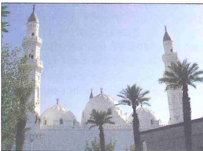
Mescid-i Kubâ'nın ön cephesi

tek on altı olmak üzere toplam 36 kare destek ve ön duvarı birbirine bağlayan çifte kemerler üzerine oturtulmuştur. Önde bulunan üç büyük kubbe arkadakilerden, onların ortasında bulunan diğer ikisinden daha yüksek planlanarak önden bakıldığında simetrik olarak gittikçe yükselen bir görüntü oluşturulmaya çalışılmıştır. Altı büyük kubbenin iki yanında dörderden sekiz küçük kubbe mevcuttur. Renkli mermerlerden geometrik desenlerle kaplanmış avlunun üç tarafında 6 m. çapında elli altı küçük kubbenin örtüğü revaklar yer alır. Avlunun ortasına gerektiğinde açılabilen elyaftan modern dev bir çadır yapılmış, böylece cuma namazlarında güneşin sicağından korunan avludan da faydalanılması sağlanmıştır. Mescidin avlusuna iki yanda ikişer, kuzey duvarında bir taçkapıdan girilir. Avlu ile ana yapı arasında duvar yoktur. Ortada büyük kubbeye uygun geniş bir kemerle iki yanda daha dar birer kemerli açıklık bulunmaktadır. Dikdörtgen planlı yapının dört köşesinde 47 m. yükseklikte birer minare yapılmıştır. Kare kaideler üzerine oturan ve üçgenlerle sekizgene dönüşen minarelerin gövdesi iki şerefe arası ile silindirik petek kısımlarında gittikçe incilir. Son inşaat esnasında mescidde kullanılan mermerler Türkiye'den götürülmüştür.