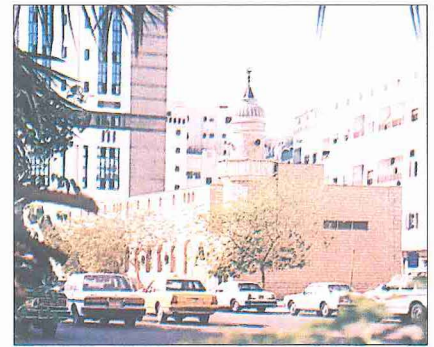
Mescid-i Cin'in eski ve yeni hali

Hz. Peygamber değişik zaman ve mekânlarda cinlere vahiy tebliğ etmek için Kur'an okurdu. Bir gün Abdullah b. Mes-ûd'la birlikte Hacûn yakınlarında bir yere gittiklerinde toprağa bir çizgi çekerek ondan bunu aşmamasını istemiş ve çizginin ilerisinde cinlere Kur'an okumuştur (Ezrakî, II, 201); bundan dolayı buraya "mevziu'l-hat", daha sonra bu noktada yapılan mescide de Mescid-i Cin adı verilmiştir. Halen camiye, isimleri bir duvarına yazılmış olan yedi cinin Resûl-i Ekrem'e bu mevkiye biat etmeleri sebebiyle "Mescid-i bey'a" da denilmektedir ( Mir'âtü'l-Haremeyn , I, 1123); ancak Akabe biatla-