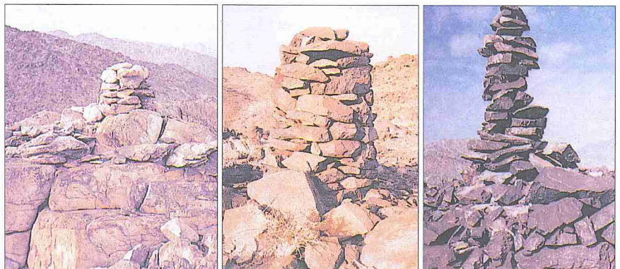
Harem sınırları gösteren alemlerden bazı örnekler

Şâfiî mezhebindeki meşhur görüşe ve Mâlikîler'den İbn Abdülberr'e göre, "Haram aylar çıkınca müşrikleri bulduğunuz yerde öldürün" (et-Tevbe 9/5) meâlindeki âyet, Bakara sûresinin Mescid-i Harâm'da savaş başlatmayı yasaklayan 191. âyetini neshettiğinden Harem'e sığınan kâfir veya âsi gürhuyla savaşmak câizdir. Hz. Peygamber de fetih günü Mekke'ye girdiğinde İslâm'ın azılı düşmanı İbn Hatal'ın, Câhiliye âdeti gereğince Kâbe örtüsüne yapışıp eman dilemesine rağmen öldürülmesini emretmiştir (Bu-