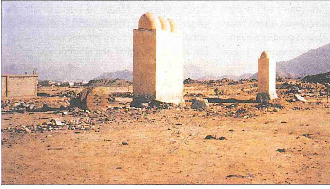
Eski Mekke-Tâif yolu üzerinde Suud b. Abdülâziz tarafından 1377 (1957-58) yılında yaptırılan alemler

Medine Haremi'nin Mekke Haremi'nden farklılık arzeden başlıca hükümleri şunlardır: Bütün fakihlere göre Medine'ye ihramla girilmesi şart olmadığı gibi lüzumu halinde geçici bir süre için gayri müslimlerin girişine izin verilmesi de câizdir. Medine Haremi'ne has bir ibadet veya kurban yoktur. Medine Haremi'nin ağaçlarını ihtiyaç duyulan eşyanın yapımında kullanmak (Buhûti, II, 474), otunu da hayvanlara yedirmek câizdir (Ebû Dâvûd, "Hac", 99). Ulemânın çoğunluğuna göre ağacını kesmenin, otunu yolmanın ve hayvanını avlamanın da herhangî bir cezası yoktur. Şâfiî'nin eski görüşü ile Ahmed b. Hanbel'den gelen bir rivayete göre ise bunlara ceza uygulanır. Medine Haremi dışında avlanan kimse'nin avını harem alanına sokmasında bir sakınca görülmemiştir. Ancak Mâlikîler'e göre bu ruhsat sadece Medineli avcılar için geçerlidir. Mescid-i Nebevi'de kılınan namaz, Mescid-i Harâm hariç diğer mes-cidlerde kılınarlardan daha faziletli sayılmıştır (yk. bk.).