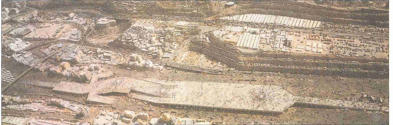
Cemerât mevkiinden genel görünüş - Mekke / Suudi Arabistan

Arefe günü Arafat vakfesinden sonra Müzdelife'ye doğru yola çıkan hacılar sabah namazını Müzdelife'de, ilk vakti olan alaca karanlıkta kılarlar ve Meş'ar-i Harâm'daki vakfenin ardından güneş doğmadan Mina'ya hareket ederler. Mi- na'ya vardıkları zaman Akabe cemresi- nin yanında, ihrama girdiklerinden beri söyledikleri telbiye*yi kesip bu cemre için hazırladıkları yedi çakıl taşını "Bi- millâhi Allahüekber" diyerek teker te-