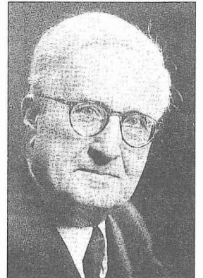
Hüseyin Sadeddin Arel

İstanbul Belediye Konservatuarı'nda ders verdiği sıralarda, Türk müzikisinin nazariyatı ve tatbikatı ile ilgili fikirlerini benimseyen öğrencileri Arelci adı ile anılmaya başladı. Sonraları, bu yeni şartlar içinde yapılan eğitim hamleleri Arelcilik akımı olarak nitelendirildi. Bu akımın il-kelerini şu şekilde tesbit etmek müm-