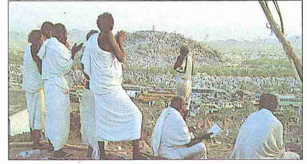
Arefe günü Arafat'ta vakfe duası yapan bir grup hacı

Arefe günü, haccın temel rüknü olan vakfenin o gün yapılması sebebiyle bü-yük önem taşımaktadır. Bu günün önemi-ne, faziletli ve makbul duanın o gün yapılan dua olduğuna dair hadisler var-dır (bk. Şevkânî, IV, 70; Muhibbüddin et-Taberî, s. 392). Vakfe, arefe günü zeval vaktinden kurban bayramının birinci gün-ü fecrin doğuşuna kadar olan süre içinde yapılır (geniş bilgi için bk. VAKFE). O gün vakfenin dışında yapılması gere-ken başka önemli hususlar da vardır. Hacıların terviye* günü (8 Zilhicce) Mek-ke'den Mina'ya gidip orada geceledik-ten sonra arefe günü sabah namazını Mina'da kılarak güneşin doğuşunu ta-