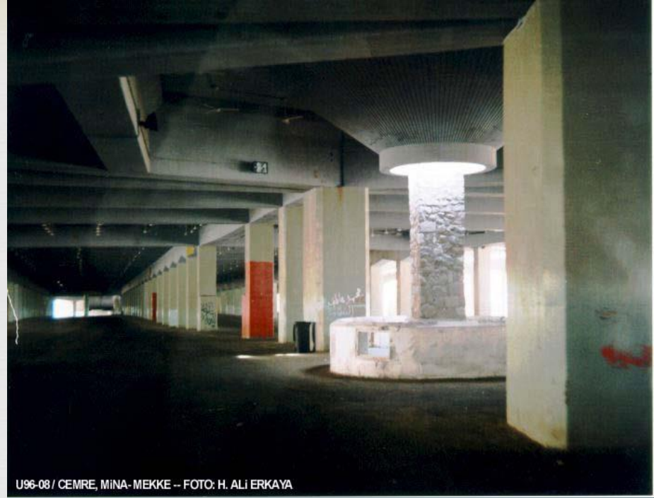
U96-08 / CEMRE, MINA-MEKKE