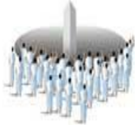
Orta Cemre 7 tas