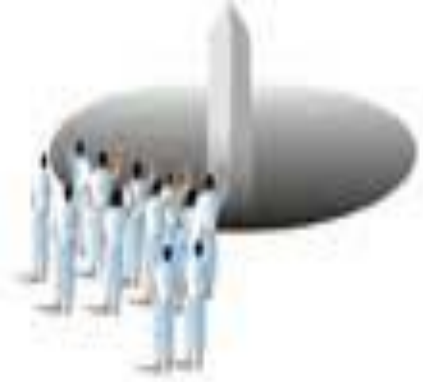
Büyük Cemre (Akabe) 7 tas