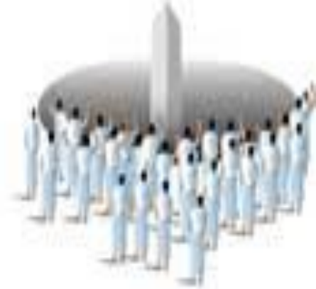
Küçük Cemre 7 tas