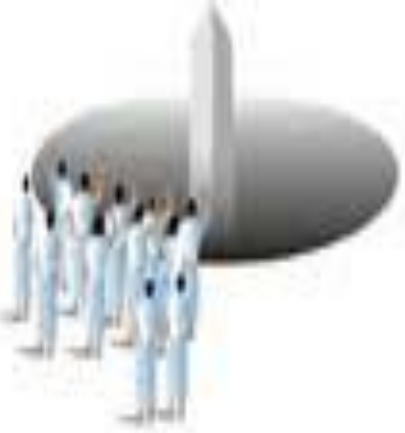
Büyük Cemre (Akabe)